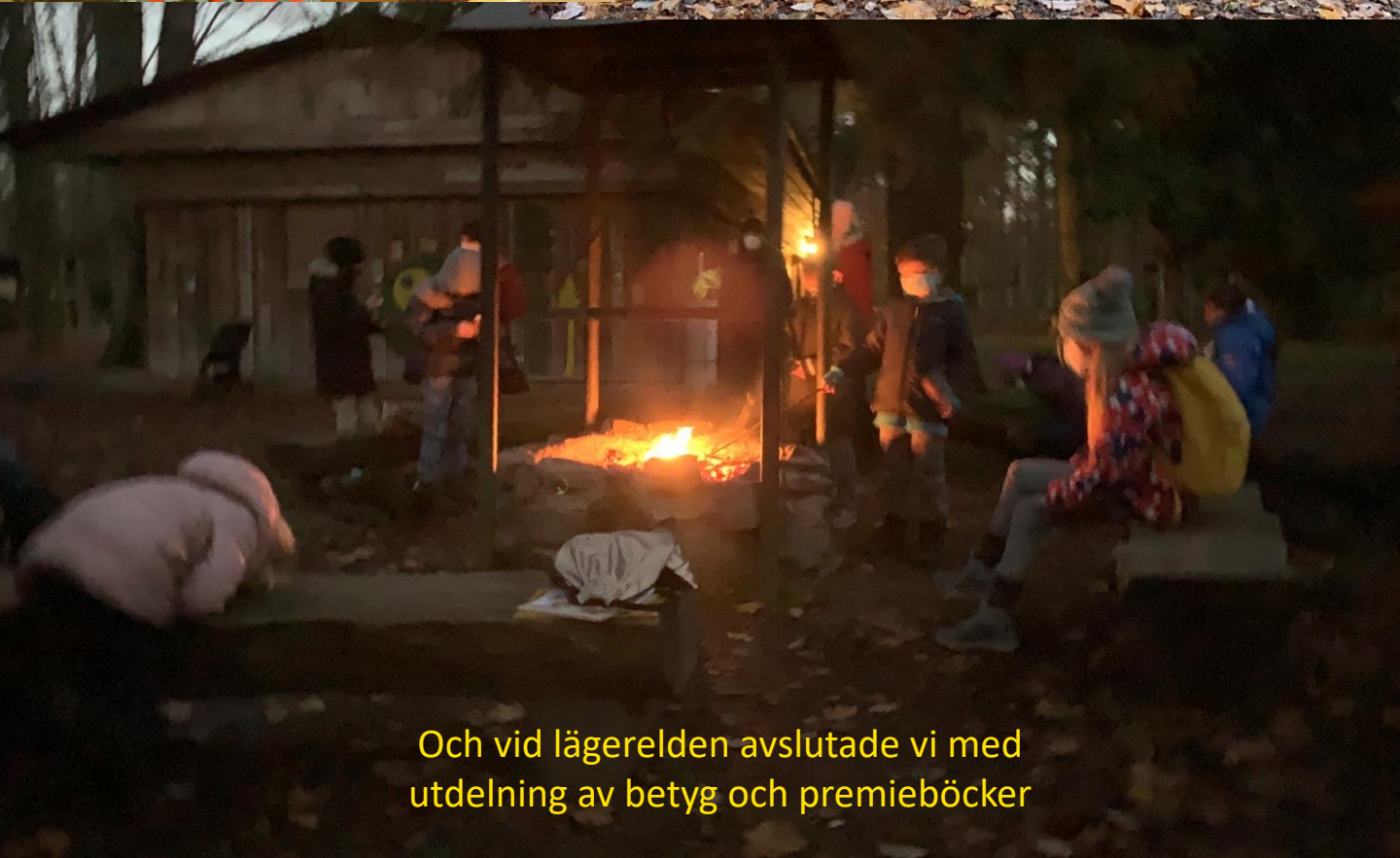
Och vid lägerelden avslutade vi med utdelning av betyg och premieböcker