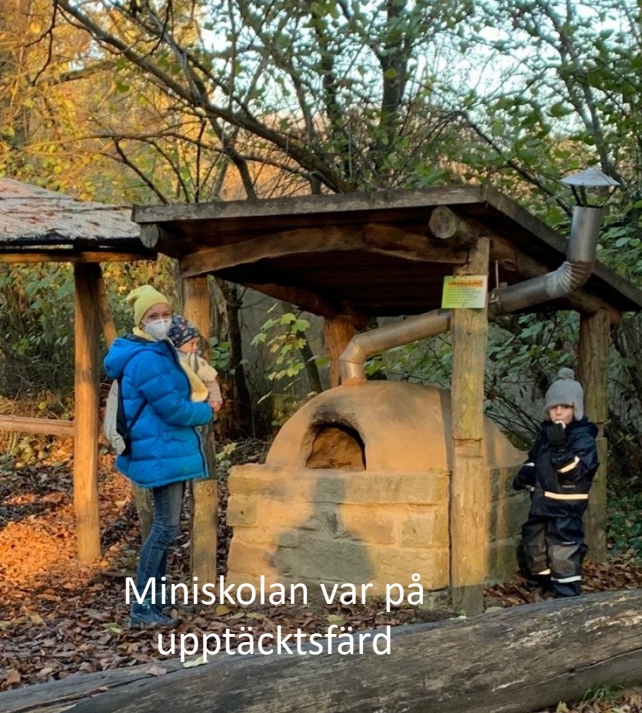
Miniskolan var på upptäcktsfärd