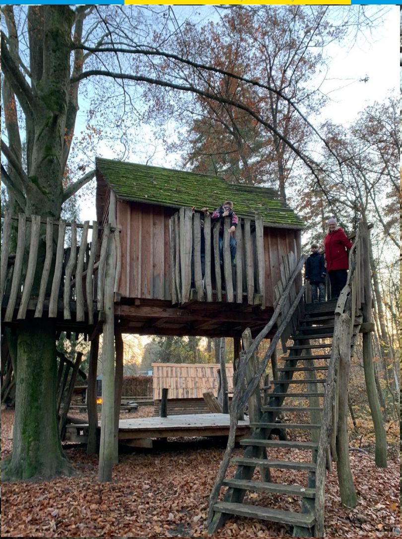
Lågstadiet hade kovan som klassrum