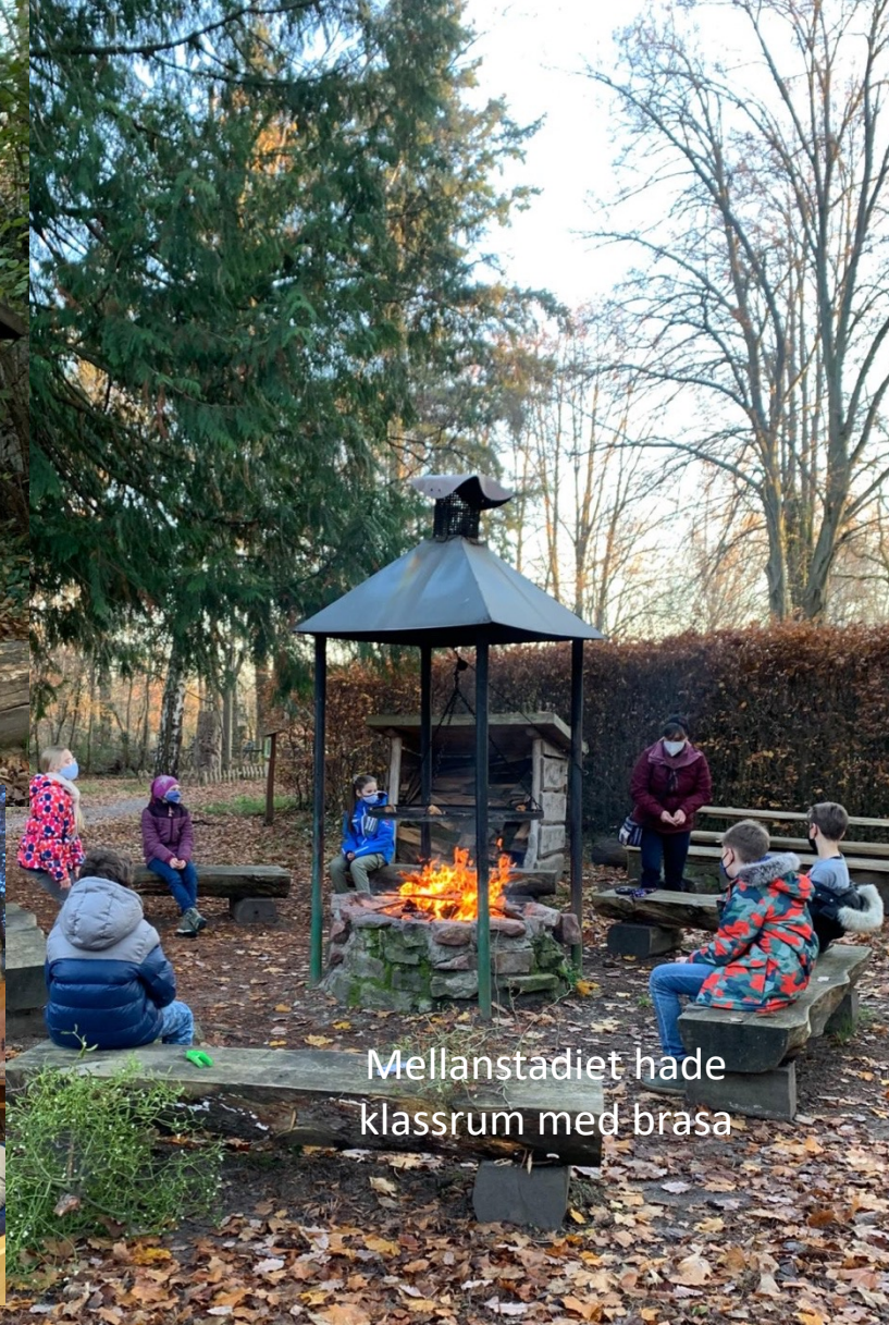
Mellanstadiet hade klassrum med brasa