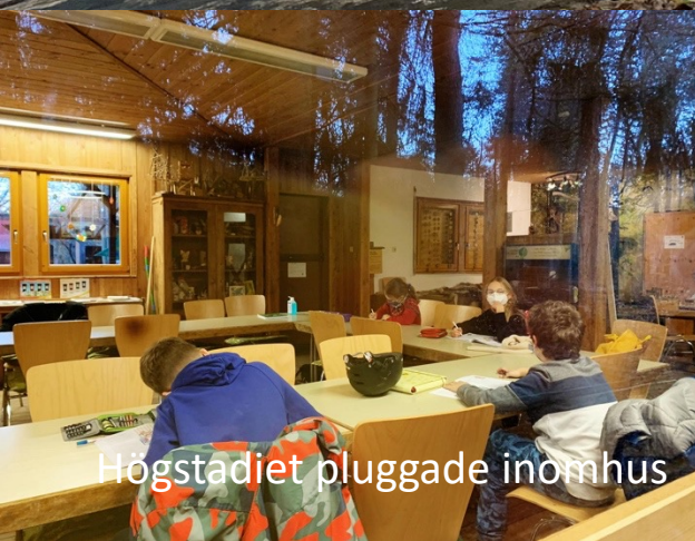
Högstadiet pluggade inomhus